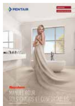
Manuel pour sols chauds et confortables

Découvrez aussi toutes nos documentations disponibles auprès de votre distributeur