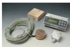
Pour le déneigement des rampes : VIA-DU-20

Découvrez aussi toutes nos documentations disponibles auprès de votre distributeur