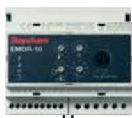
Pour la protection contre le gel : EMDR-10

Nous vous proposons une gamme de rubans chauffants autorégulants de différentes puissances, fournis en bobine et qui se coupent à la longueur sur site. Les unités de contrôle sont là pour vous offrir une économie d'énergie maximale.